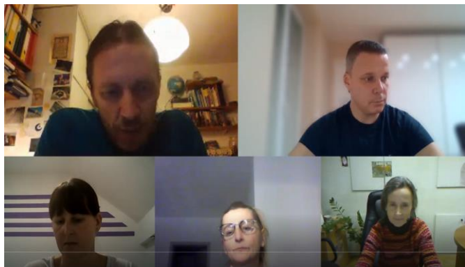
Delo na daljavo s starši, decembra 2019