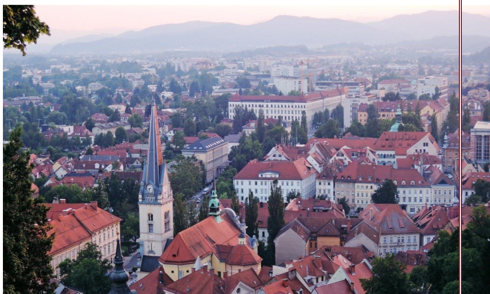
V Ljubljani je sedež projekta YoungMob za Slovenijo