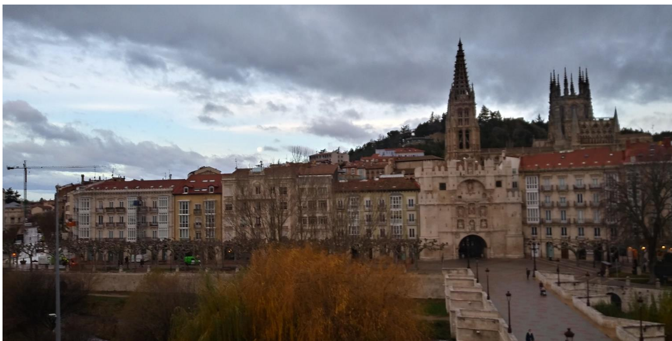
Burgos, december 2019